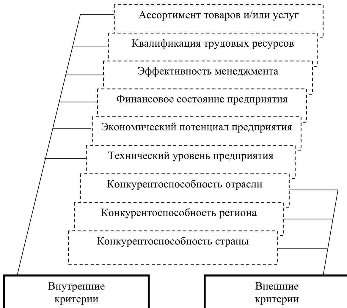
Рис. 3. Система критериев оценки конкурентоспособности франчайзинговых предприятий

доступ к рынкам капитала; предоставление форфейтинговых услуг.