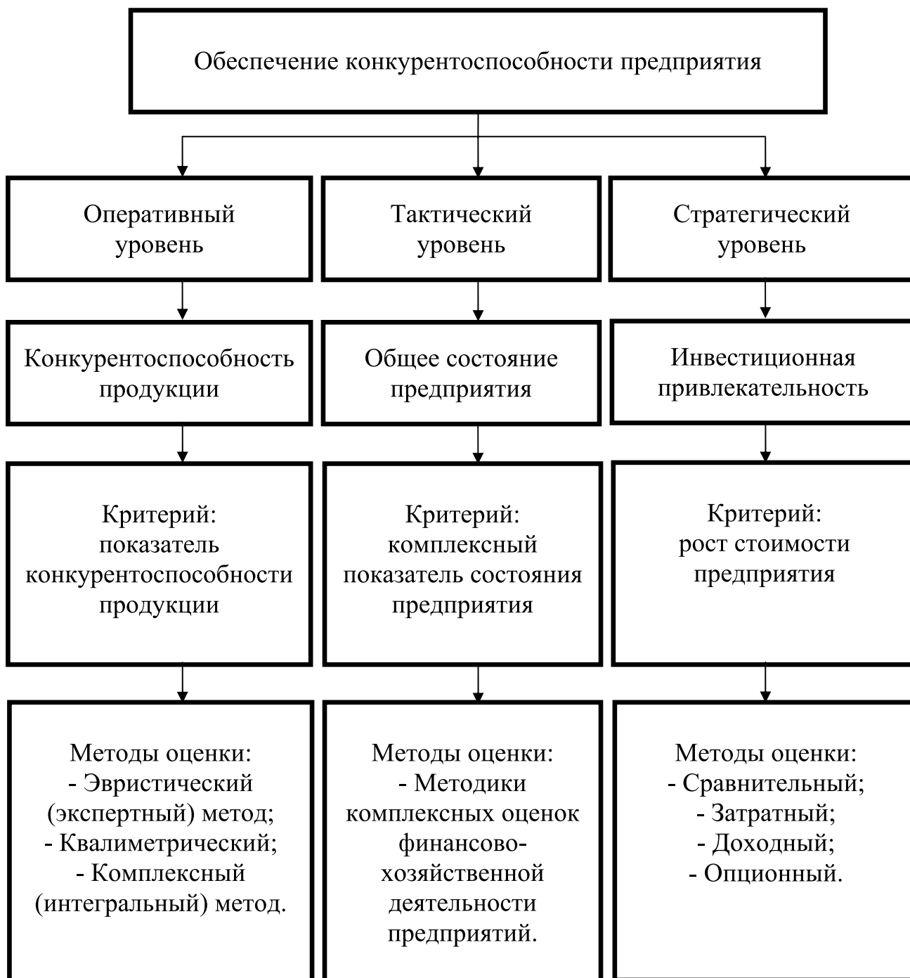
Рис. 1. Комплексная система обеспечения конкурентоспособности предприятия

По мнению отечественных специалистов А.М. Кроткова и Ю.Я. Еленевой, оценку конкурентоспособности предприятий необходимо рассматривать с позиции системы, т.к. разделение данного процесса на компоненты снижает эффективность